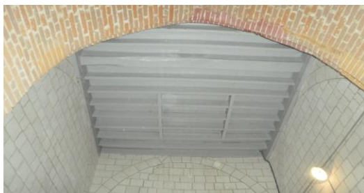
Un plancher pour le clocher de l'église SAINT-FURSY DE GUESCHART / Chantier de Mr DUFETELLE