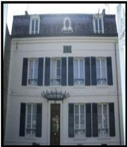
Maison Jules vernes du CROTOY

Nous ne rénovons pas cette superbe villa, en revanche nous travaillons dans une maison juste en face , au rejointoiment du mur de la maison MIGNON !