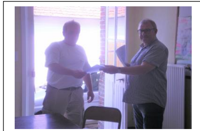
MR LE MAIRE remet une attestation de satisfaction de la mairie et une Conserve Saint Christophe à nos salariés ! Merci pour eux !