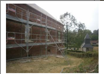
MAIRIE DE VAUX MARQUAINNEVILLE LIONEL MAILLARD