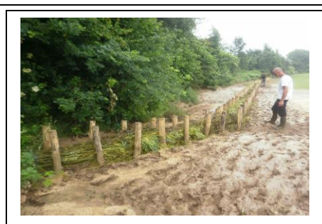
STOP A LA BOUE pour les communes de la CCV DU VIMEU (Jérôme VOTIEZ)

EXCLUSIVITE : FRANCE 3 PICARDIE VIENT FILMER LE MOULIN D'HEUZECOURT !!