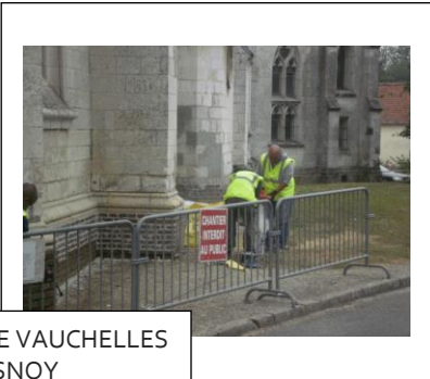
EGLISE DE VAUELLES LES QUESNOY CHRISTOPHE LECUYER