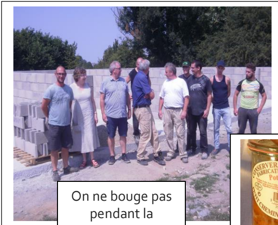
On ne bouge pas pendant la photo!!!