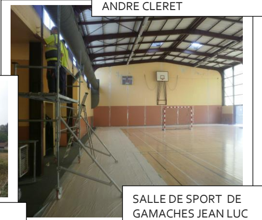
SALLE DE SPORT DE GAMACHES JEAN LUC MENIVAL